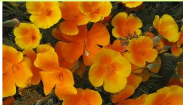
✿ Rose trémière