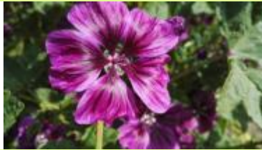
✿ Mauve crispée