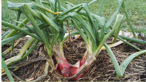
Oignon perpétuel rocambole