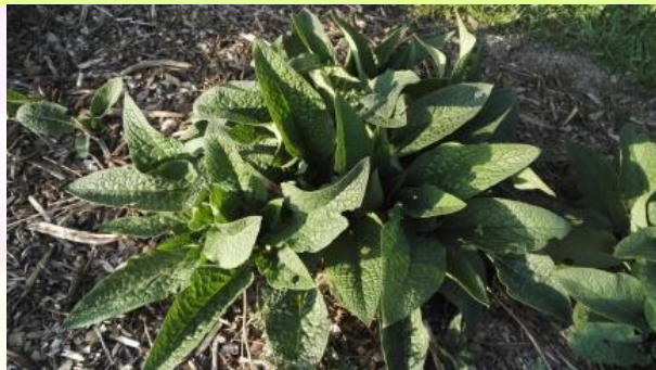
Consoude de Russie 'Bocking 14'