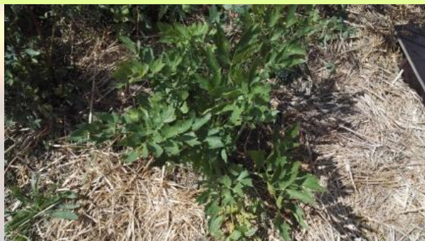
Céleri perpétuel (Livèche) 'Levisticum officinale'