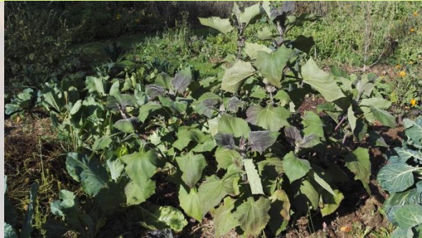
Poire de terre / yacon (Bulbes annuelles gélifs)