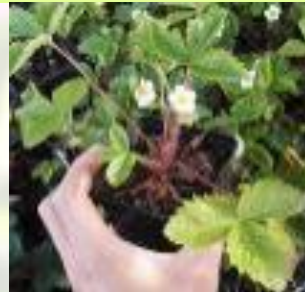
Fraise des Bois