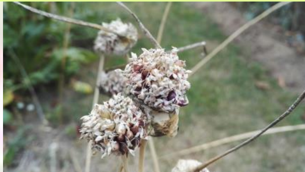
Ail perpétuel rocambole