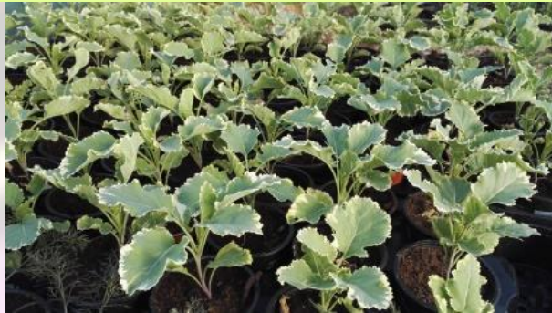
Chou perpétuel Daubenton