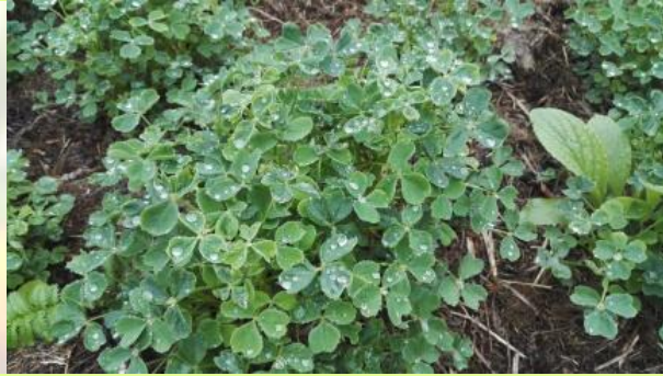
Oxalis tubéreux (oca du Pérou)